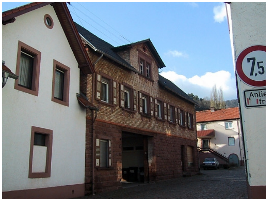
Bild 6: Material und Farbgebung... Typische Fassadenmaterialien sind Verputz, regelmäßiges Sandsteinmauerwerk oder Sichtmauerwerk aus Tonzie- geln.