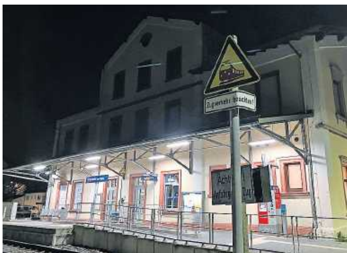
Den Bahnhof Annweiler erreicht man ab 14. Dezember abends eine Stunde länger als bisher.

Übrigens: Bereits ab Dienstag, 25. November, können Fahrten,