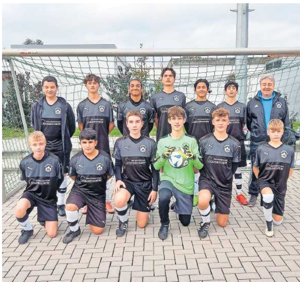
Schülermannschaft erfolgreich unterwegs