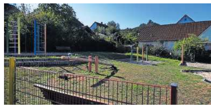
Dieser Spielplatz soll schöner werden.

Bereits 2016 und 2018 war Annweiler mit Projekten unter anderem durch den Verein Zukunft Annweiler (Saubermachaktion) und den Brauchtumsverein Bindersbach 2016 (Rehbergquelle) und 2018 (Zick-Zack-Weg zur Kletterhütte) beim Freiwilligentag der Metropolregion vertreten. Dieses Mal soll ein Spielplatz in Annweiler verschönert werden. Klettergerüst und