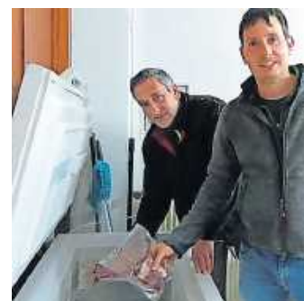
Übergabe des Wildschweinbratens.

Zum Jahresabschluss bedanken sich die Tafelverantwortlichen bei allen, die die Tafel Bad Bergzabern e.V. mit der Außenstelle Annweiler über das Jahr 2019 auf vielfältige Weise unterstützt haben, seien es größere oder kleinere Spenden gewesen, oder der Beitritt zum Verein.