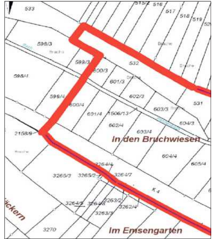
Anlage zur Bekanntmachung „Bebauungsplanverfahren Hahnenbach 4. Änderung“ der Stadt Annweiler am Trifels- unmaßstäblicher Auszug aus der Flurkarte der Gemarkung Gräfenhausen, Darstellung des Geltungsbereiches-----