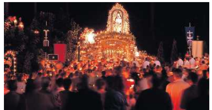
Feierlicher Zug zur Lourdesgrotte.