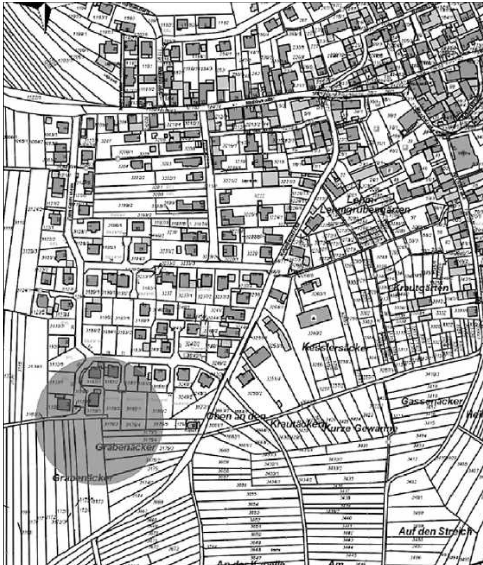
Anlage zur Bekanntmachung der Ortsgemeinde Wernersberg - Bebauungsplanverfahren „Bei der Kapelle – unmaßstäblicher Auszug aus der Flurkarte – Darstellung des Änderungsbereiches:

schließlich den textlichen Festsetzungen, der Begründung liegen nunmehr in der Zeit vom 08. Juni bis einschl. 09. Juli 2018 in der Bauabteilung der Verbandsgemeindeverwaltung Annweiler am Trifels, Messplatz 1, Zimmer 137, 76855 Annweiler am Trifels, während den üblichen Dienststunden zu jedermanns Einsicht öffentlich