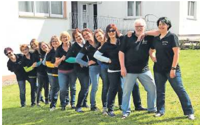
Rainbow - der Chor lädt zur musikalischen Feier ein. FOTO: PS

Die Sänger freuen sich auf viele Besucher. |ps