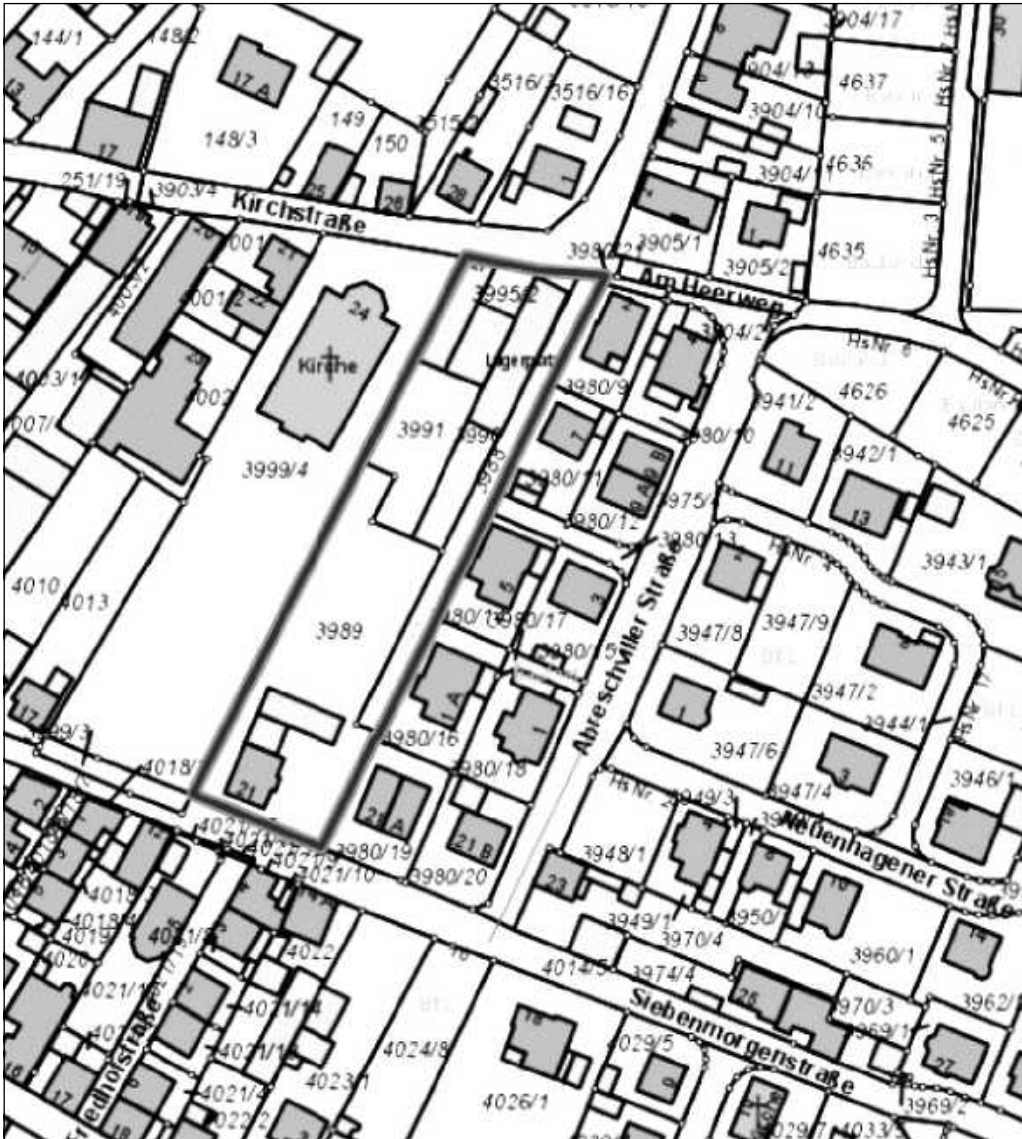
Anlage zur Bekanntmachung „Bebauungsplanverfahren „Abreschviller Str.“ 1. Änderung der Ortsgemeinde Albersweiler - unmaßstäblicher Auszug aus der Flurkarte Albersweiler Darstellung des Geltungsbereiches: