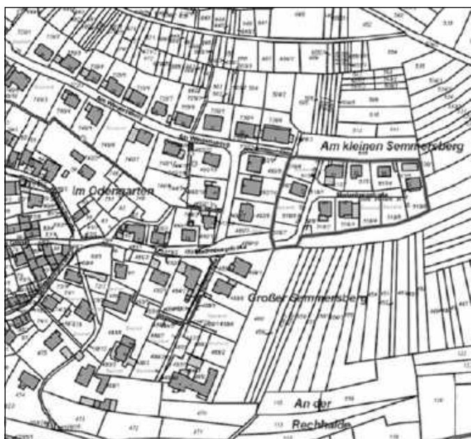
Anlage zur Bekanntmachung „Bebauungsplanverfahren Semmersberg“ 2. Änderung der Ortsgemeinde Waldhambach - unmaßstäblicher Auszug aus der Flurkarte Darstellung des Geltungsbereiches: -----