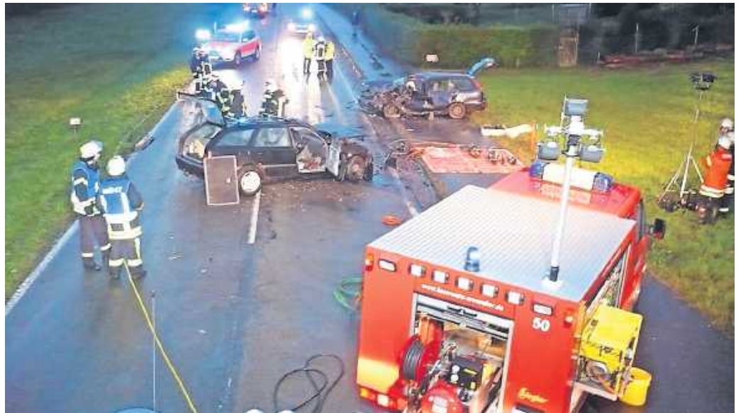
Zu vielen schweren Verkehrsunfällen, wie hier zwischen Silz und Vorderweidenthal, musste die Feuerwehr Annweiler in 2014 ausrücken.