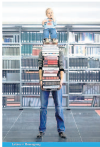
Die familienfreundlichen Hochschulen in der Metropolregion Rhein-Neckar